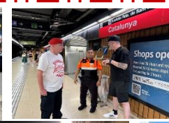
スペイン・ バルセロナ