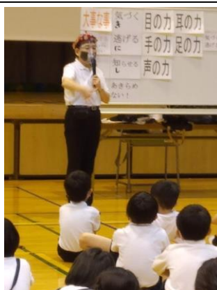
小学校での安全セミナー

GA創設からの様々なメンバーの並々ならぬBRICK精神と努力が、複雑で混迷極まる現代社会においても歴然と歩みを進め、社会や子ども達の安全安心な生活を守る大事な事業を展開してきたことへ尊敬と信頼を持ち続け、これからも支部メンバーとともに地域の安全安心へ貢献してまいります。