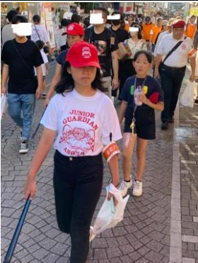
清掃活動に参加したリリーさん

**** 学校でボランティア活動をする課題があったのがガーディアン・エンジェルズの活動に参加することになったとき