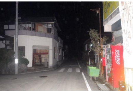
↑住民の皆さんの避難に伴い 無人になっている地域を 重点的に巡回しました