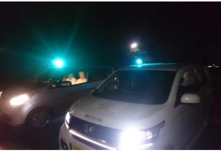
↑青色回転灯装着車両