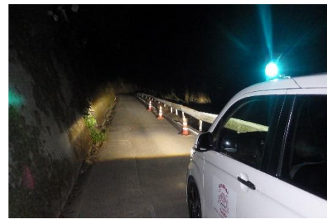
↑パトロール中 (大洲市・菅田地区)