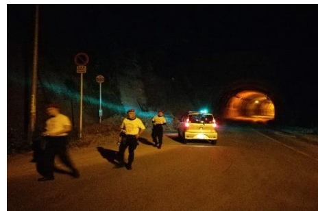
↑パトロール中 (西予市)