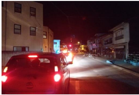
↑パトロール中 (西予市 野村町)